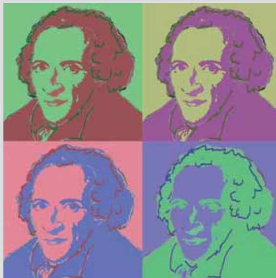
HOMMAGE

Das Programm des ersten Moses-Mendelssohn-Symposiums in Berlin ist inspiriert von den Lebensthemen des Aufklärungs-Philosophen, der bei seinen Zeitgenossen in ganz Europa als „der Jude von Berlin“ bekannt war. In seiner berühmten Stammbuch-Eintragung „Bestimmung des Menschen. Wahrheit suchen, Schönheit lieben, Gutes wollen, das Beste tun“ hatte dieser Emanzipationspionier seine Vorstellung von der conditio humana formuliert. Die Tagungsvorträge über das Lebenswerk, das Menschenbild und die Rezeption Mendelssohns korrespondieren mit der Untersuchung jener zahlreichen, unterschiedlichen Portraits, die von ihm – dem bis zu Einstein am häufigsten abgebildeten Juden – bereits zu Lebzeiten entstanden waren. So bereitet das interdisziplinäre Symposium auch eine Moses Mendelssohn-Ausstellung vor, die voraussichtlich 2020 im Jüdischen Museum Berlin stattfinden soll.